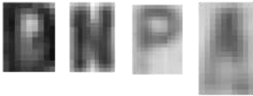
Şekil 3. Bazı problemliler karakterler. Sırasıyla a) Boş olması beklenirken ortası dolu olan bir D harfi. b) H olarak tanınan bir N harfi. c) Alt kısmı silik bir P. d) Alt kısmı belirsiz bir A.

Bu çalışmada ele alınmamış olsa da, aynı yöntemin alfanümerik karakterler için de kolayca uyarlanabilir olduğu açıktır. Çoğu ülke plakalarında harf ve rakamların yerleri belli olduğundan hangi tür karakterin aranması gerektiği bellidir. Bu durumda rakam kümesi daha küçük olduğu için hem hazırlık hem de test aşamalarının harflerden daha kısa süreceği düşünülmektedir.