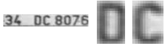
Şekil 1. a) Plaka örneği. b) ayrıştırılmış karakter örnekleri.

Plaka karakterlerini tanıma problemi, bir örneği Şekil-1a'da verilmiş olan plaka resminden Şekil-1b'deki gibi ayrıştırılmış olan karakterlerin tanınması şeklinde tanımlanmaktadır. Gerçek uygulamalarda karakterlerin otomatik olarak ayrıştırılması gerekmektedir, ancak araştırmamızda karakter örnekleri el ile ayrıştırılmış ve algoritmaya girdi olarak ayrıştırılmış karakterler verilmiştir. Çalışmalarımız sadece alfabetik karakterler üzerinde gerçekleştirilmiş olsa da nümerik karakterlerin de çalışmaya ve yorumlarına dahil edilebileceği açıktır.